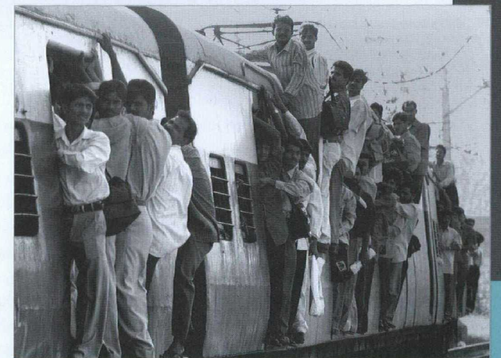
Modernisation des réseaux de transport : tout est à faire.

Les résultats sont probants. Par exemple, d'avril à septembre 2004, la croissance du PIB de l'Inde s'est située à 7 %, malgré la baisse de la production agricole liée à la mauvaise température. Selon le ministère de la Statistique et des programmes, le secteur industriel et celui des services ont affiché une croissance particulièrement vigoureuse au cours de cette