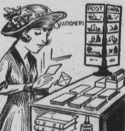
Vous choisissez le papier à écrire et les enveloppes que vous aimez le mieux, de votre bel et grand assortiment.

Bloc Le Madawaska, porte voisine de la Pharmacie Edmundston.