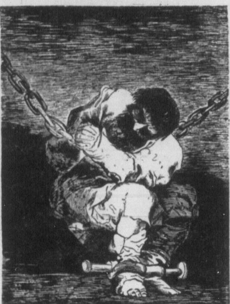
Український працюючий люд в польсько-шляхетській неволі.