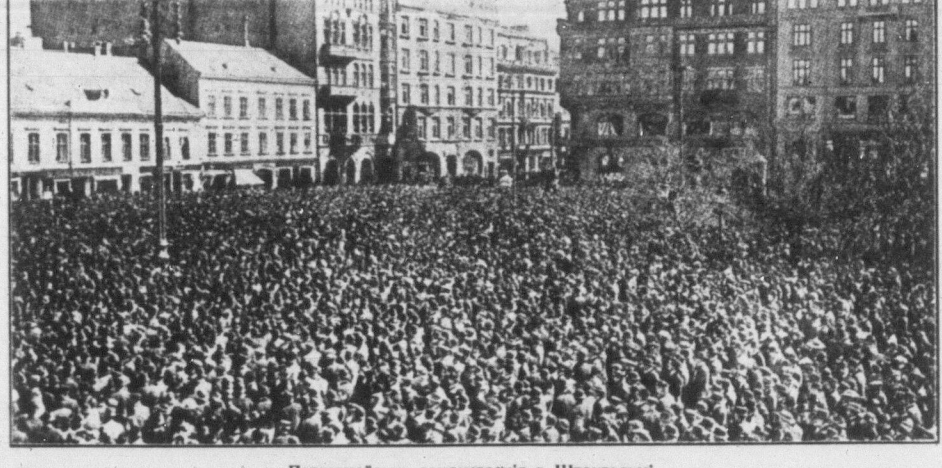
Першомаявська демонстрація в Штотгольмі.