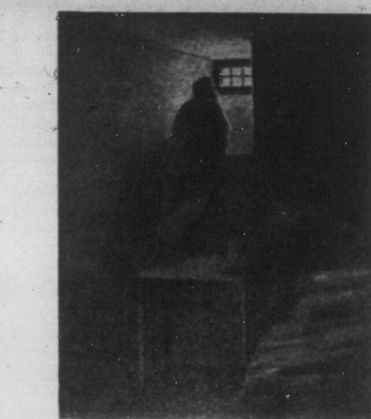
В польсько-шляхетській тюрмі за правду і волю трудових мас.

Ми, послы, сини українських працюючих мас, знаємо добре його сучасне тяжке положення, його терпіння та його невинні муки. Знаємо теж і те, що такі переживання і переслідування, адержують часом запал, ослаблюють витривалість та відбирають силу до боротьби. Прибиті і пригноблені люди халатаються безвольні та безкритично за всі, незважайтні виходячі від найгірших ворогів обшарників. Тому остерігаємо Вас, брата робітників і селян, не вірте таким обшарникам! Не дайте себе заманити гарним словом панів-патріотів, які провадять коштами з польською реакційною буржуазією. Памятайте оце одне: ми українські робітники і селяни маємо тільки одного союзника, а ним є революційний табор робітників і селян без різниці реалізації і національності. Тільки солідарно не-