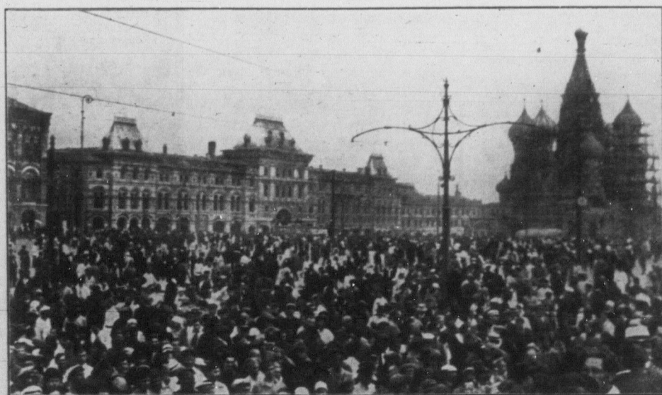
Першомайська демонстрація в Москві.