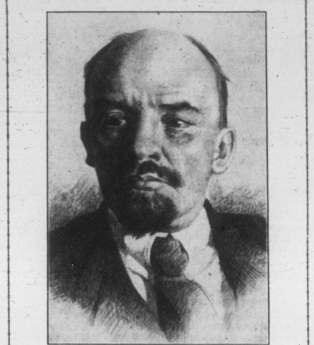
НИКОЛАЙ ЛЕНІН (ВОЛОДИМИР ІЛІЧ УЛЯНОВ) уродився 10. квітня 1870; помер 21. січня 1924 р.

марксовській концепції. Але соціально-економічні умови часу Маркса, продукційні сили суспільства, в згоді з цією-ж концепцією, ще не достигли тоді не дозволили Марксові, цьому борцві з повсякчасним полум'ям в грудях, безпосередньо вдатися до негайного практичного здійснення перетворення капіталістичного світу на соціалістичний. Маркс тому і вважав тільки до теоретичного розроблення й до наукового підготування загального плану цього майбутнього перетворення, він наперед намалював загальну схе-