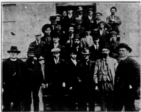
PREMIERS HOMESTEADERS DE FALHER.

REPOSSE.—Un homesteader peut résider avec père, mère, fils, fille, frère ou sœur, sur une terre agricole, de pas moins de 80 acres, qu'il ou elle possède, ou sur un homestead dont lui ou elle a fait l'inscription dans les environs, ce qui signifie à pas plus de 9 milles du homestead de celui qui en fait la demande. Cinquante acres de homestead doivent être mis en culture dans ce cas, au lieu de 30 acres, tel que cela se fait quand il y a résidence directe sur le homstead.