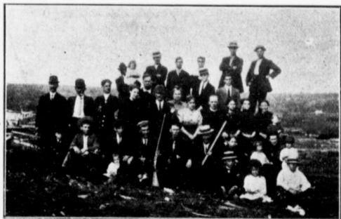
EXCURSION DE JUILLET 1912.

REPONSE.—Généralement parlant, oui; on peut compter sur une quantité suffisante. La plus grande quantité de pluie tombe en mai et en juin, juste au moment où l'on en a le plus besoin.