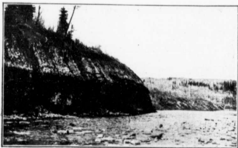
VEINES DE CHARBON À FLEUR DE TERRE.

La majeure partie de ces prairies, au dire des experts du Gouvernement fédéral, seraient de magnifiques jardins si la main de l'homme était là pour les remuer; le sol en effet, est des plus riches terres d'alluvion. Vous trouvez de six pouces à un pied de terre noire sur un fond de glaise mélangée de sable. Inutile de vous dire qu'un tel terrain est des plus productif. L'expérience des vieux cultivateurs du pays est là pour le prouver. Les magnifiques récoltes de blé, d'avoine, d'orge, de blé d'inde, de pois, que tous les ans nous renouvellement, prouvent surabondamment ce que j'avance. L'an dernier, sur premier passage de