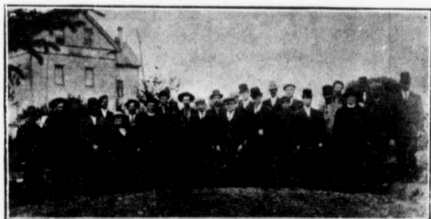
COLONS ARRIVANT À GROUARD—1911.

12.— Est-il permis de résider avec un frère qui a fait la demande de l'autre moitié de la section pour laquelle j'ai fait la demande?