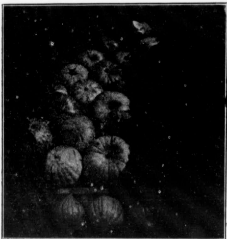
CITROUILLES DE GROUARD.

colons, savoir : Bestiaux des espèces suivantes ; bêtes à cornes, veaux, moutons, pores, mulets ou chevaux, jusqu'à concurrence de dix têtes, au total. Meubles, objets de ménage et vêtements (ayant servi) chariots ou autres véhicules pour l'usage personnel (ayant servi) à l'exception des automobiles, omnibus, corbillards ou véhicules similaires ; machines agricoles ; instruments aratoires et outils (le tout ayant servi) ; bois mou de construction (pin, sapin, ou essences semblables seulement) et bardeaux, le tout ne pouvant excéder un volume de 2,000 pieds ou son équivalent ; ou bien, au lieu de bois et bardeaux, mais non concurrentement, une maison démontable ; grains de semence, petite quantité d'arbres ou arbrisseaux ; un petit lot de volailles vivantes ou d'animaux familiers, et la nourriture nécessaire aux bestiaux pendant leur transport. Le minimum d'un wagon complet est de 24,000 livres.