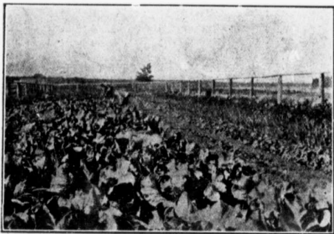
JARDIN AU FORT VERMILLON.

Pour ce qui est de l'élevage, un fermier est certain d'obtenir du succès; j'en ai rencontré un grand nombre qui vendaient les poules $1.00 ou plus chaque, et les vaches de $50.00 à $90.00, le beurre 50 cts la livre. Les chevaux de traits sont dispendieux dans le district de la Rivière la Paix, mais à Edmonton, le 9 mars 1914, des colons en ont acheté de bonnes paires, pesant de 1,200 à 1,400 livres par cheval, pour $350 à $475, à $500, le choix était idéal. Une paire de bons chevaux est suffisante pour tout le travail de la ferme, incluant le cassage de la terre.