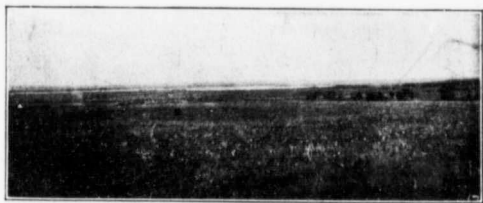
GRANDE PRAIRIE — LAC DES OURS AU LOIN.

la terre dans la colonie de Falher, l'avoine a rapporté 107 minots à l'acre, mais je puis dire que la moyenne de tout le district a été de 70 à 90 minots d'avoine à l'acre et de 40 à 50 minots de blé par acre. Remarquez que lors de la dernière exposition de Chicago, Monsieur T. A. Brick, alors Député du district, obtenait le premier prix pour son blé.