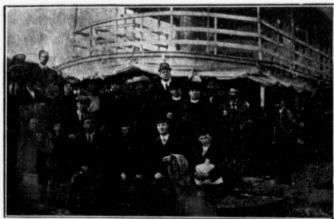
EXCURSION DE MAI 1913.

REPONSE.—Non, d'Edmonton la nouvelle compagnie Edmonton Dunvegan & B. C. a établi un service régulier, les mardis et vendredis de chaque semaine