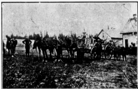
PREMIERS COLONS PARTANT DE GROUARD POUR LEURS HOMESTEADS.