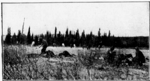
PETIT BOSQUET.

Quant à l'écoulement des produits, chaque fermier vend sur place ce qu'il a, soit aux nouveaux colons, soit aux constructeurs des lignes de chemin de fer, soit aux compagnies de la Baie d'Hudson, Revillon Frères, Police du Nord Ouest, etc., qui les utilisent dans leurs diverses exploitations, mais l'automne prochain, les chemins de fer qui sont actuellement en voie de construction, seront à la disposition des colons pour transporter la récolte dans les grandes villes. Jusqu'à aujourd'hui, le colon a surtout cultivé l'avoine, qui est en grande demande auprès des constructeurs de chemin de fer, qui emploient un grand nombre de chevaux. Cette céréale s'est vendue de $1.00 à $1.50 le minot et le blé $1.25 à $1.50 le minot. Les patates se sont vendues de $3.00 à $5.00 la poche; et de plus, les fermiers qui avaient d'autres légumes à vendre n'ont eu que l'embaras du choix pour s'en défaire.