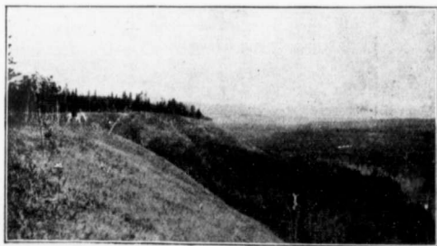
VALLÉE DES PINS.

La conformation du sol est accidentée, ainsi près des Montagnes Rocheuses, le pays est montagneux et boisé, plus à l'est, à partir du Fort Saint-Jean. Sur les deux rives de la Rivière la Paix, vous trouvez des