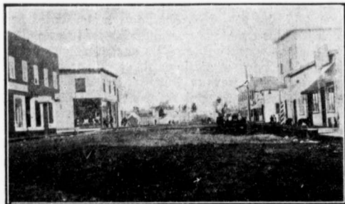
LE NOUVEAU GROUARD.

Maintenant parlons de l'avenir du pays. Il serait facile à un père de famille de s'y tailler un magnifi-