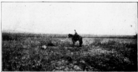
RÉGION DE GRANDE PRAIRIE.

N'allez pas croire que le pays n'est favorable qu'à la culture. Au contraire, les fermes "mixtes" réussissent à l'élevage ; le foin sauvage, le jargeau ou petits pois sauvages abondent, ainsi qu'une quantité d'herbes odoriférantes, très goûtées des bêtes à cornes, et