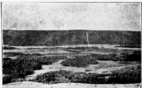
FERME À LA TRAVERSE DE LA RIVIÈRE LA PAIX.