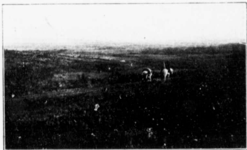
PRAIRIE POUCE COUPÉ.

prairies entrecoupées de magnifiques lisières de bois, formées de pin, d'épinette, de liard, de tremble, de bouleau et d'épinette rouge, etc. Pour ne mentionner que ce que nous avons de plus renommé dans le pays, nous prenons plaisir à vous énumérer les noms des prairies suivantes: Pouce Coupé, Les Deux Rivières Brûlées, Dunvegan, Rivière Tête Blanche, Spirit River, Grande Prairie, Vermillon, Rivière au Foin, Petite Rivière Rouge, Rivière Prairie, Sawridge, Rivière du Cygne.