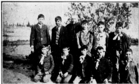
JEUNES ÉCOLIERS PRÈS D'UN POMMIER À GROUARD.

En hiver la saison étant de courte durée le colon n'a pas besoin de garder ses animaux longtemps dans les étables. Le fait est que les chevaux de service, et les vaches laitières sont les seuls animaux qui reçoivent cette attention. Dès la fin de mars vous pouvez voir les animaux au large et trouvant leur subsistance avec avantage. Durant la saison froide nous avons le vent "chinook" vent chaud et très doux, qui nous vient généralement en décembre et janvier de l'Océan Pacifique et qui nous apporte des dégels.