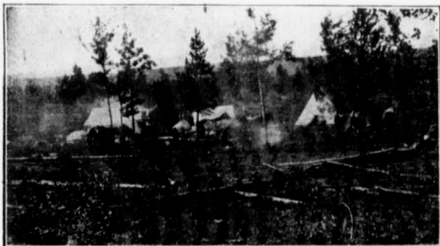
LA VIE DE CAMP.

conséquemment le beurre de la Rivière la Paix a un sent à merveille et l'on trouve tout ce qui est nécessaire de goût délicat des plus recherchés. Tout connaisseur le distinguera sur n'importe quel marché.