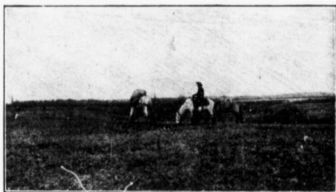
PRAIRIE DE POUCE COUPÉ.