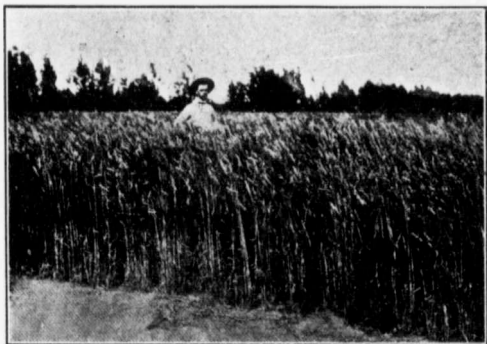
FERME AU FORT VERMILLON.

nu des personnes qui, de passage dans l'état du Rhode Island en hiver, supportaient plus difficilement 8 degrés au-dessous de zéro que 25 degrés dans l'Ouest, et l'on m'a même répété que l'humidité du climat de la Nouvelle Angleterre exerçait une influence désavantageuse sur les parties du corps le plus susceptibles au rhumatisme, chose inconnue chez-nous. Il n'y a pas de maladies pulmonaires ou autres maladies endémiques contractées dans notre région, au contraire il y a eu des médecins qui sont venus se guérir dans cette partie du pays.