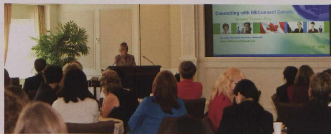
Lancement de WEConnect Canada à Toronto en avril 2009

Utilisez les dernières technologies. Faites l'essai d'outils Internet comme les séminaires en ligne, les cyberconférences, Skype, LinkedIn, Twitter, Flickr et autres. On peut s'asseoir à la même table même lorsqu'on se trouve très loin les uns des autres.