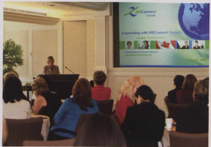
Launch of WEConnect Canada in Toronto, April 2009.

Use the latest technologies. Explore Internet-based tools such as webinars, web-conferencing, Skype, LinkedIn, Twitter, Flickr and others. It is possible to be at the same table even when people are worlds apart.