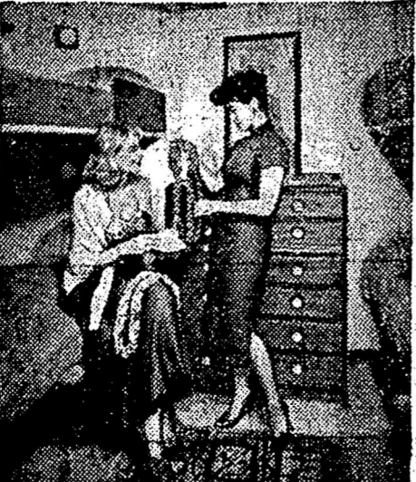
內船。部內船客覽遊鋪臥四有另。備設節調溫氣熱冷有。擇選供可船客鋪臥。