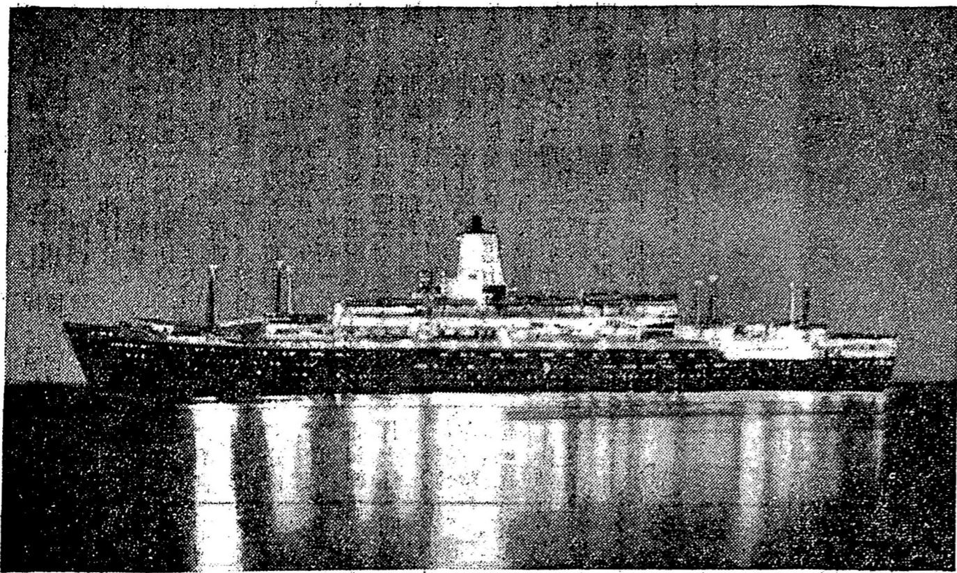
港香往駛日一廿月八於定號華秀與輪客華豪頓千九萬二司公船輪洋平大東方

美聯社台北電。於一九四九年大陸變色後收盤之中央銀行。大概將於明年正月復活。重作國方之主要國立銀行。台灣銀行屆時將降為合資銀行。