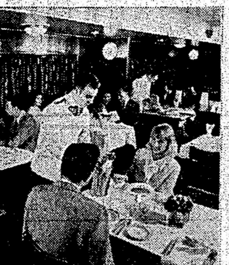
餐輪客司公船輪洋平大東方。美精錦菜。置佈適舒的廳。選擇君任。多繁目名。

唐番餐館生意出賣 位於錦繡唐人街。生意向來興隆。傢俱用具齊備。現因人力缺乏。願以廉價出賣。如有僑胞里。欲買此業者。函商面議均可。 華僑餐館謹啓 通訊處 W. K. Chop Suey, 167 W. Victoria St., Kamloops, B. C.