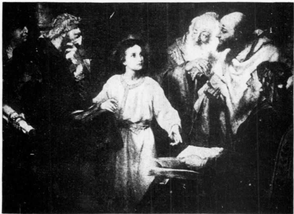
Jésus au milieu des Docteurs.