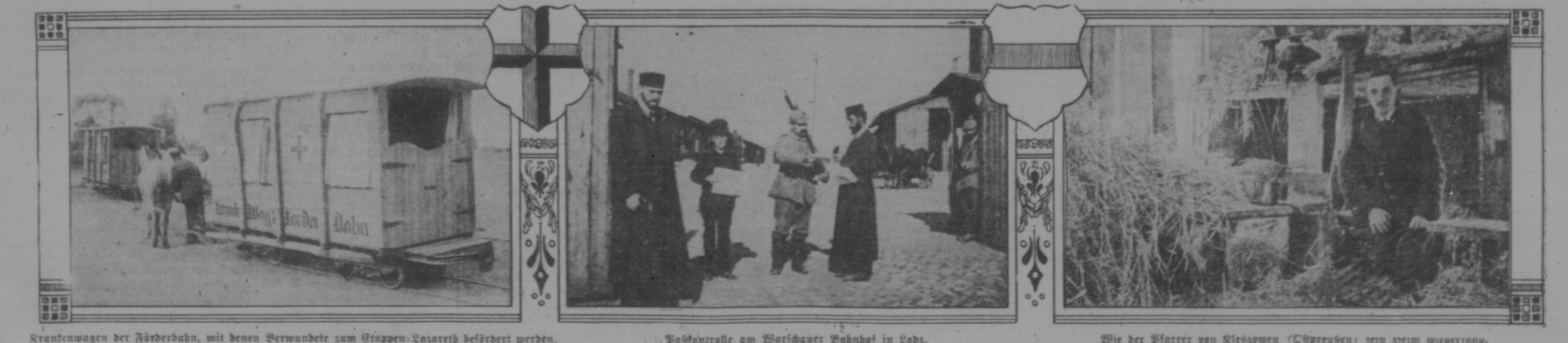
Krankenwagen der Haderbahn, mit denen Verwandte zum Erspen-Asarath befördert werden. Polizeikontrolle am Bahnhof in Lody. Die der Hader von Mesgopen (Chaprasen) zum Heim wiederzuringen.