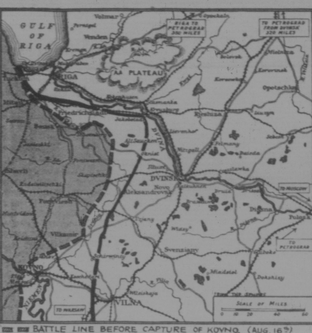
Die Schlachtlinie der deutschen Armeen, wie sie sich auf Grund der Berichte in vorläufiger Linie ergab