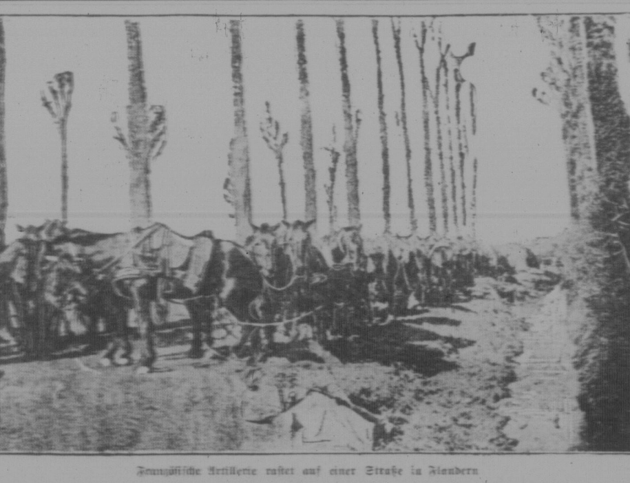
Genüßliche Reiterei ruhet auf einer Straße in Nordens