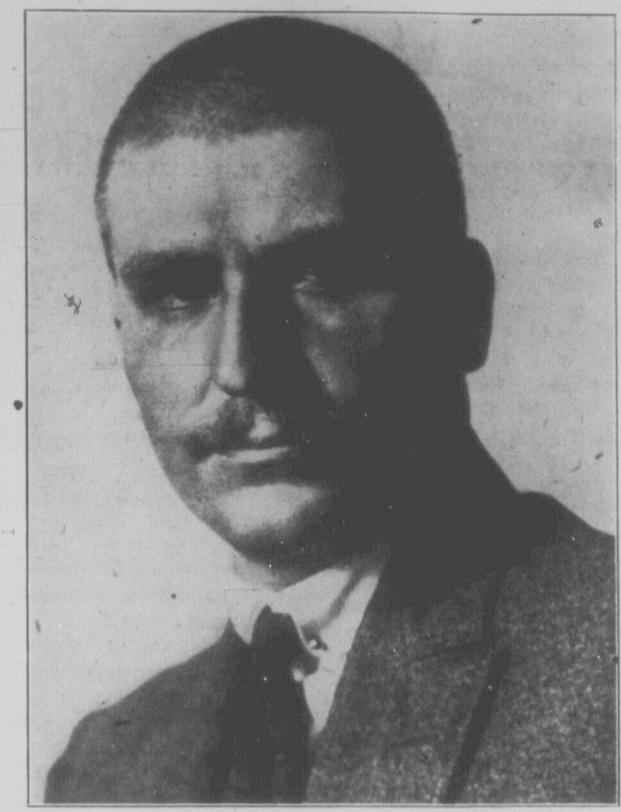
ВЛАС ЯКОВЛЄВИЧ ЧУБАР голова Ради Народних Комісарів Радиської України.

Дня 12. липня минуло п'ять років перебування тов. Власа Яковлевича Чубаря на посту голови Ради Народних Комісарів Радиської України. З цього приводу широко розскасалася радиська преса, а тов. Чубар отримав багато привітних телеграм. Президія ВМЦФК ухвалила винагородити Чубаря орденом червоного прапору.