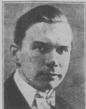
Шведський професор Мальмгрена, який загадково загинув на далекій півночі.

Сам Нобіле, коли прилітає шведський летун Лундборг, сідає на літака, а всіх своїх товаришів подорожі, тоді, як деякі з них так хорі, що ледві держаться дух тіла, покидає. Така поведінка італійських генералів та офіцерів говорить про нікчемність тих людей, про брутальність фашизму. Треба припускати, що і сама смерть Мальмгрена є дуже загадкова. Чи не вишолоділи науковими нотатками професора, а потім приписати собі дослід, постарався позбутися професора.