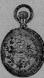
billigare än andra priser parti.

eller äfven The High Commissioner for Canada 17 Victoria st., London, S. W., England.