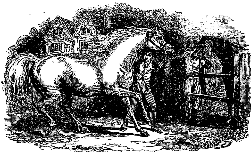
Etalon de race Percheronne.

sants employés aujourd'hui à la culture des champs, mais à l'étonnement succédera la réflexion et avec elle la comparaison des moyens employés et des substitutions possibles. Mais le but le plus important à atteindre c'est la dissémination des meilleurs modèles au moyen de nos fabricants d'instruments aratoires, dont la construction pourra être facilement modifiée, de manière à rencontrer toutes les exigences d'un bon travail, avec les améliorations empruntées aux modèles exposés à leur étude. Depuis longtemps les fabricants se plaignent à juste titre de l'impossibilité qu'il y a pour eux de répondre aux besoins de l'agriculture nouvelle faute de modèles pour les guider. C'est donc un pas immense fait dans la bonne voie et la création d'une bibliothèque agricole ne contribuera pas peu à compléter