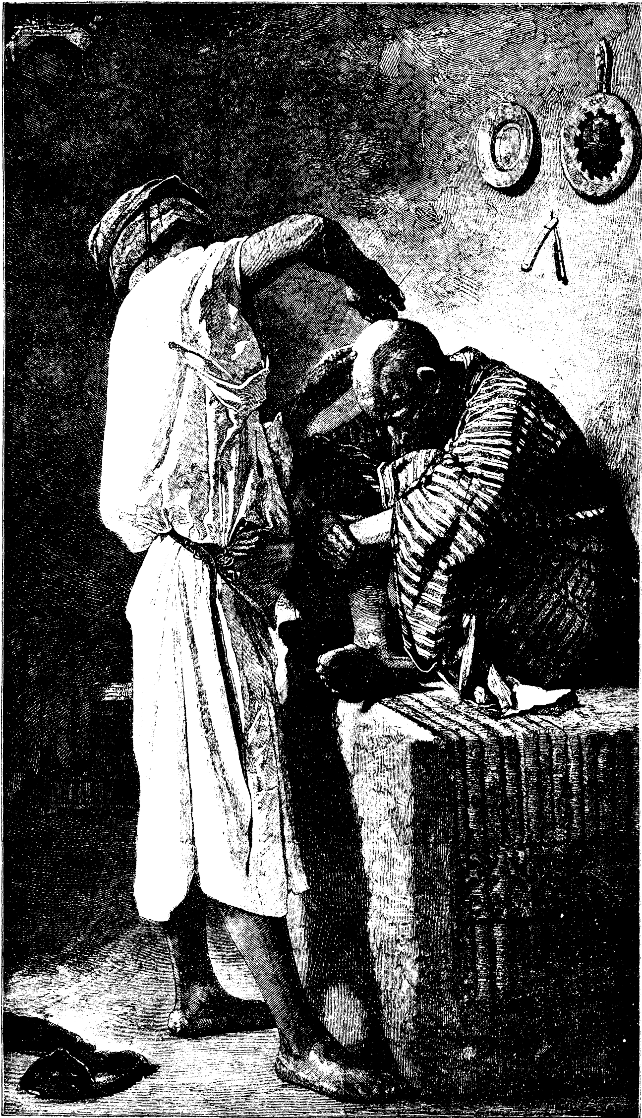
LE BARBIER TURC.