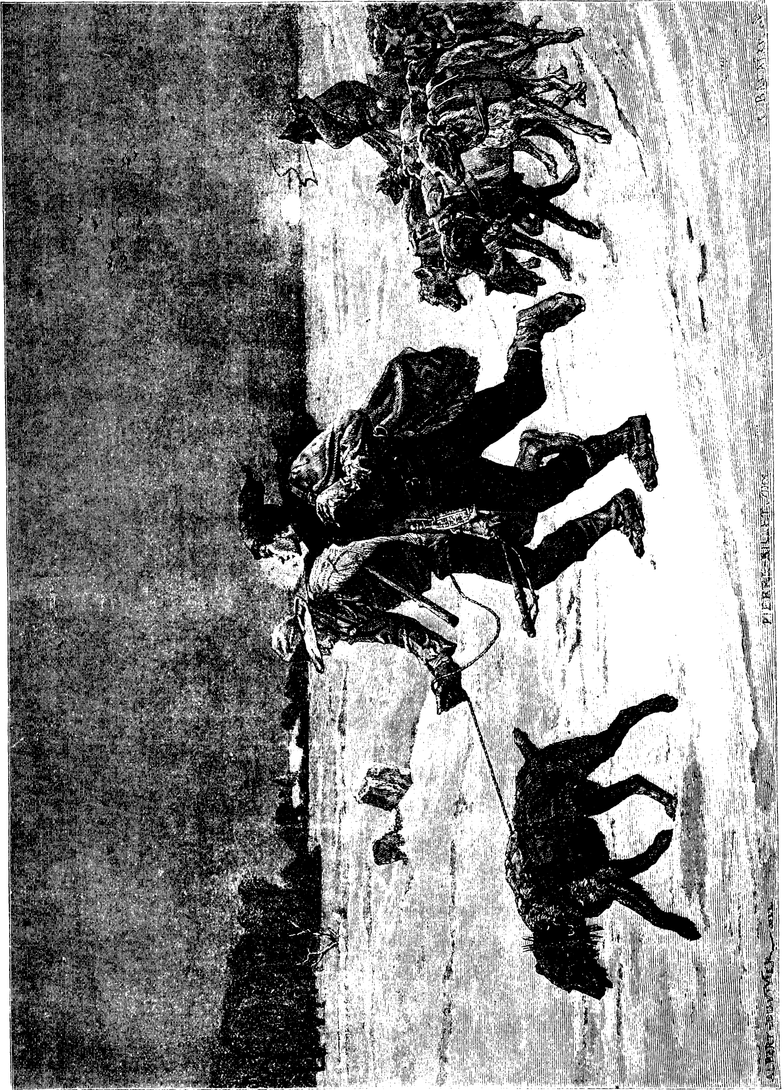
LES FRAUDEURS DE TABAC.