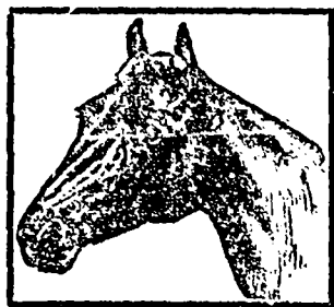
Marque de Fabrique

VOUS L'AUREZ SI VOUS L'EXIGEZ DE VOTRE EPICIER