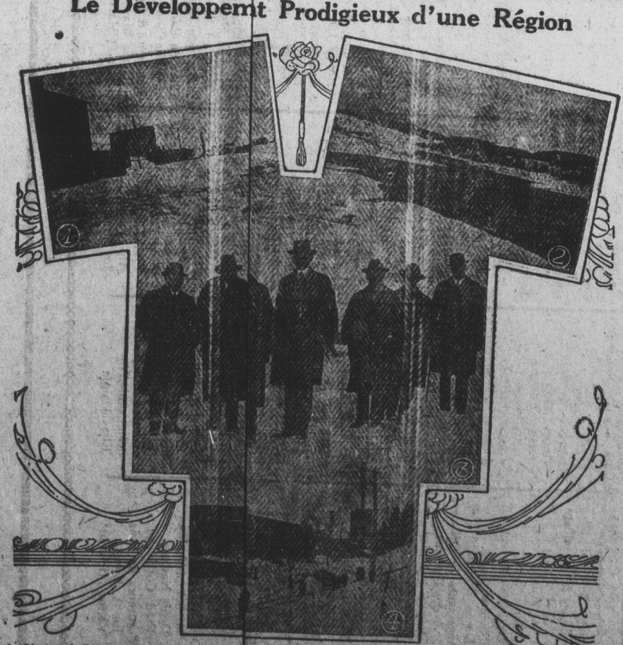
1.—L'usine de l'Aluminium Company of Canada. 2.—Le Chute-a-Caron, en hiver. 3.—L'honorable M. Alexander Macdonald et un groupe d'industriels sur l'île-aux-Lievres. 4.—L'usine de papier de la Canadian Paper Company. 5.—L'usine de papier de la Canadian Paper Company. 6.—L'usine de papier de la Canadian Paper Company.

Le Développement Prodigieux d'une Région