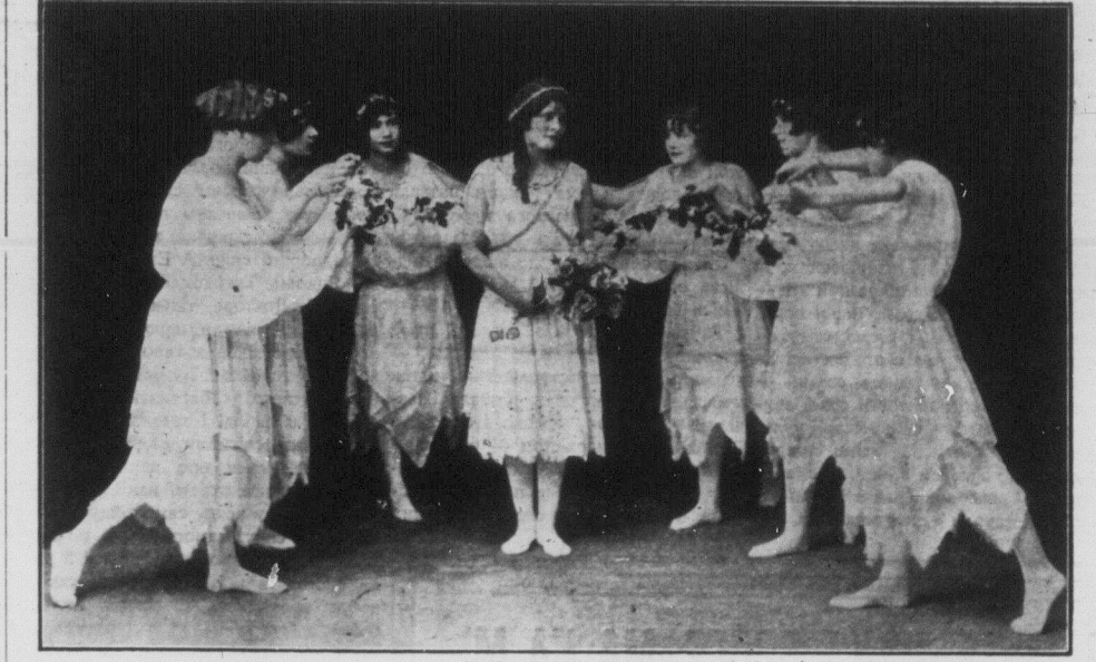
Образок групи дїчат в ролях русалок, в комедї-оперетї "Майська Ніч", за Микодеої і'оголем, яку Драмгурток при Укр. Домі в Вінніпєгу відіграє в Укр. Домі в суботу, 1. травнї, при співучастї мужського хору учнів Вищого Освітнього Курсу та дїчат маїдоїлїсток з першої групи.