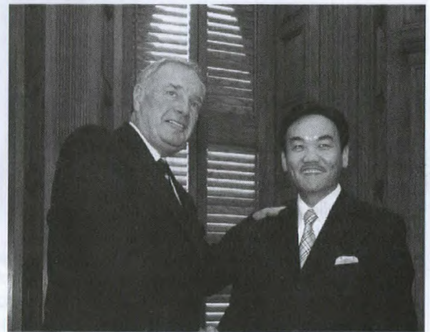
Le premier ministre Paul Martin et le président de Mongolie Natsagiin Bagabandi se sont réunis à Ottawa en octobre dernier. Ils ont réaffirmé leur volonté de stimuler les relations bilatérales entre leurs deux pays.