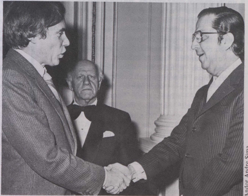
Andor Andre Sima

Durante su visita, el Ministro de Relaciones Exteriores de Venezuela fue recibido por el Muy Excelentísimo Sr. Pierre Elliott Trudeau, Primer Ministro de Canadá, y sostuvo reuniones útiles y constructivas con el Ministro de Industria y