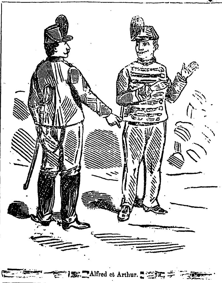
Alfred et Arthur.

Et cependant, telle avait été la fatigue des bons habitants, telle était leur bravoure, que tous étaient ensevelis dans un sommeil paisible et profond. Seul, dans son village, Arthur ne dormait point ; il rêvait d'avenir, il rêvait au bonheur du lendemain, jour où il presserait sur son cœur d'époux, une épouse jeune, belle, vertueuse, adorée. Cependant, tout en caressant mille et un rêve de bonheur, un funeste pressentiment troublait son âme ; de sombres visions qu'il chassait de son esprit comme de vains fantômes de la nuit, mais qui revenaient toujours plus forts et plus lugubres, l'obsédaient. Il voyait sa jeune épouse arrachée à son amour ; il la voyait, pâle, défaillante, enlevée par l'indien farouche ; il entendait sa voix mourante répéter encore : Arthur, Arthur, sainte Vierge veille sur lui ! Il se levait, saisissait son fusil, son épée, comme pour voler au secours de sa fiancée, puis se rappelant qu'il rêvait, il venait reprendre sa place à la fenêtre. Longtemps ces rêves de bonheur et ces lugubres visions agitaient tour à tour son cœur, lorsqu'enfin, lassé de fatigue, il s'endormit de ce demi-sommeil dans