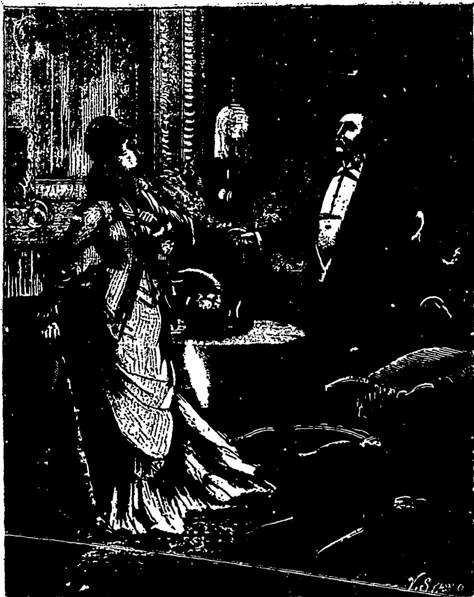
La lame aigüé et tranchante traversa l'étoffe. (Page 150).