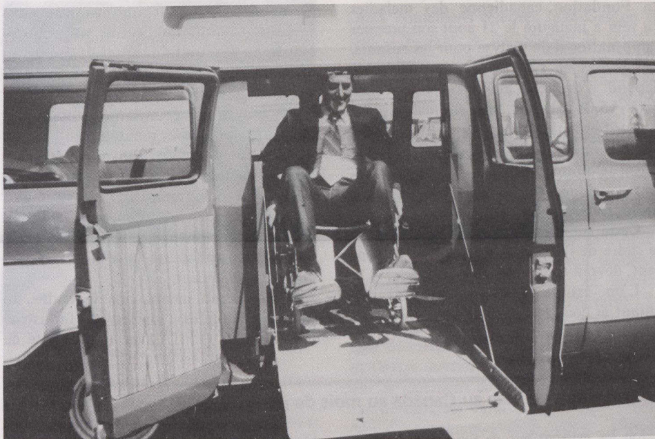
La compagnie de transport urbain d'Ottawa, OC Transpo, assure un service de transport aux handicapés qui travaillent et à ceux qui reçoivent des soins médicaux ou qui suivent des cours de niveau post-secondaire.

Le nombre de HT passe d'environ 1 p.c. pour le groupe d'âge de 5 à 24 ans, à 34 p.c. pour le groupe d'âge de 80 ans et plus. Les revenus des foyers des HT et le niveau de formation des HT sont généralement inférieurs à ceux de la population cible. Le pourcentage des femmes