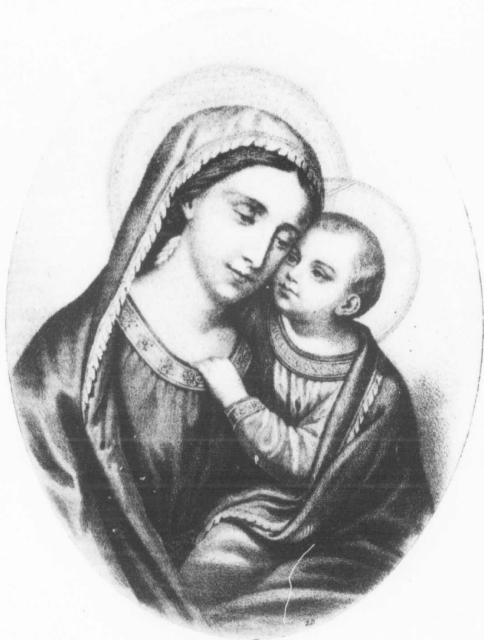
Notre-Dame du Bon Conseil