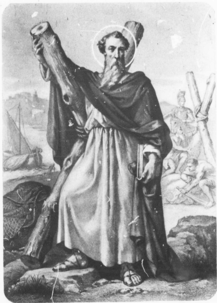
Saint André, Apotre