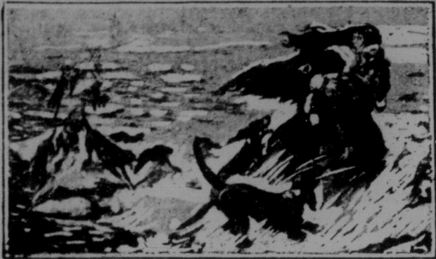
Сцена з фільму "ХАТА ДЯДКА ТОМИ": Еліза втіває по кригах леда від собак, що жуються за нею.

В СУБОТУ, 10-ГО ТРАВНЯ 1930 В УКР. РОБІТНИЧИМ ДОМІ