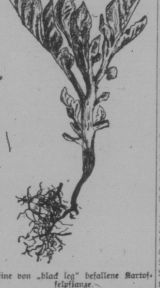
Ein von "blad leg" befallene Kartoffel- pflanze

Kontrolle der Garteninsekten Die Abteilung für Insektenkunde im Landwirtschaftlichen Ministerium veröffentlichte Zirkular No. 9, das den Ziel trägt: "Common Garden Insects and their Control."