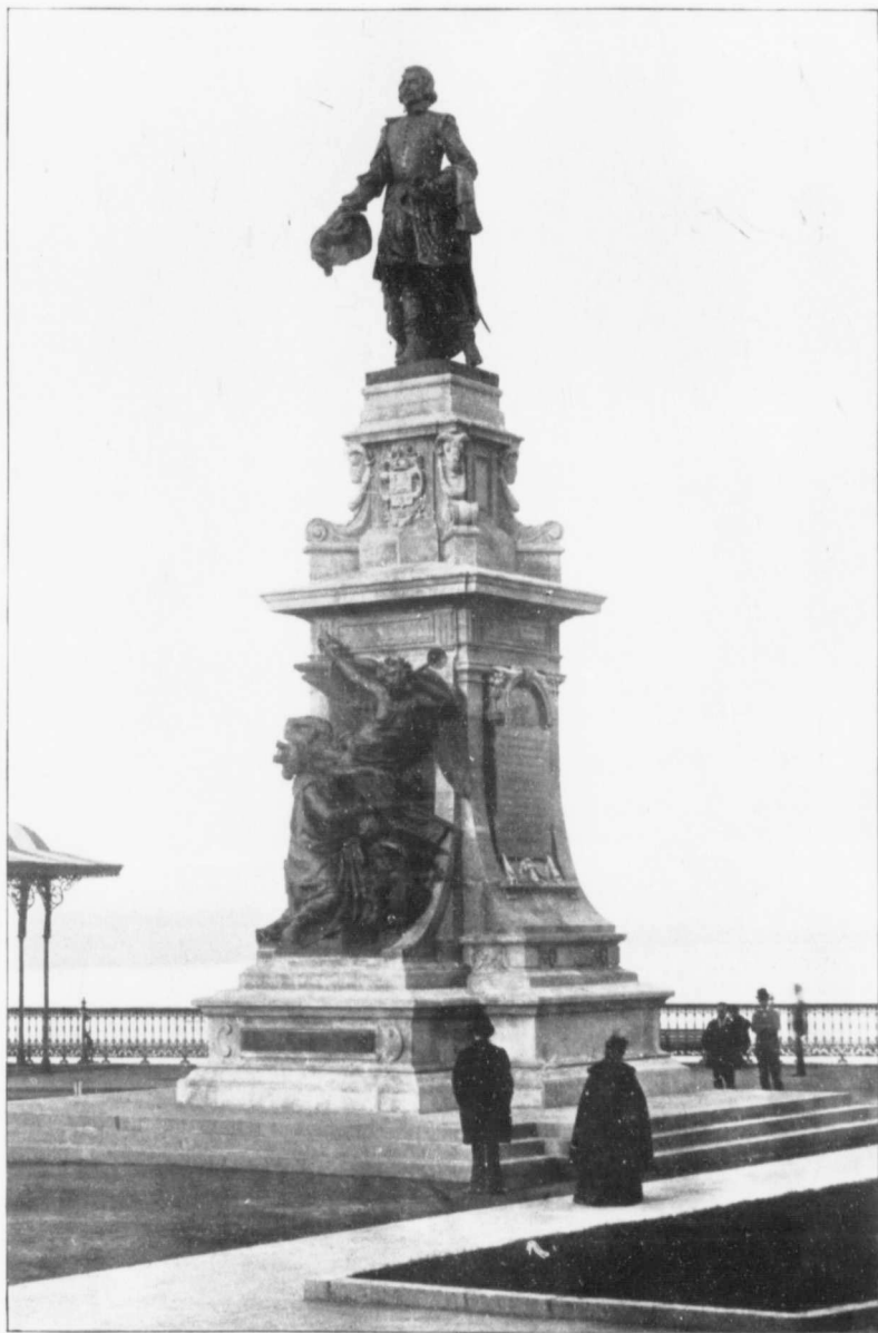
MONUMENT CHAMPLAIN INAUGURÉ À QUÉBEC LE 21 SEPTEMBRE 1898