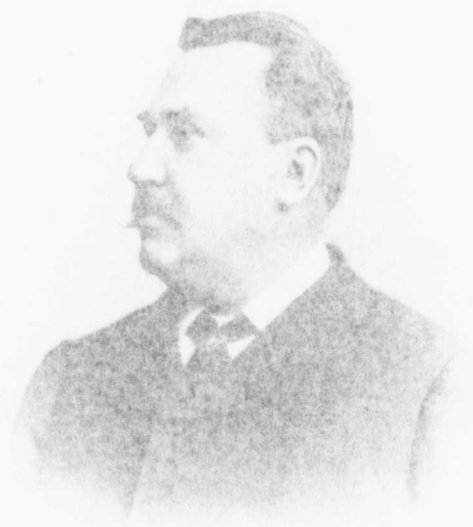
Monsieur [unreadable] Président de la [unreadable] Monsieur [unreadable]