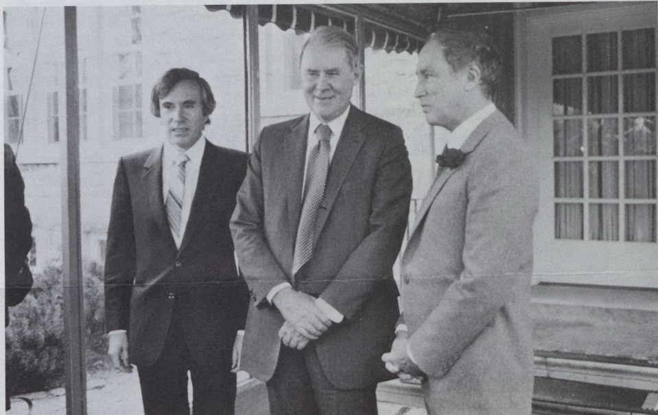
Dans l’ordre habituel, on reconnaît le secrétaire d’État aux Affaires extérieures, M. MacGuigan, le secrétaire d’État, M. Vance, et le premier ministre du Canada, M. Trudeau, devant la résidence de ce dernier.

Le secrétaire d’État américain, M. Cyrus Vance*, et le secrétaire d’État aux Affaires extérieures, M. Mark MacGuigan, se sont rencontrés à Ottawa le 23 avril afin de discuter d’un certain nombre de questions bilatérales et internationales.