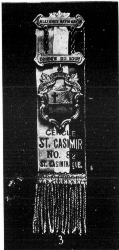
Insigne de membre combiné avec ruban réversible pour fête et deuil