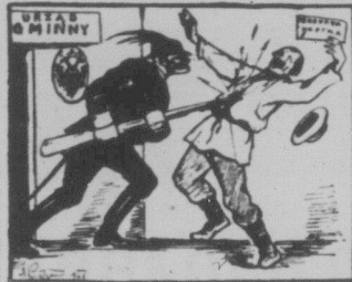
За часів монархістичної Австрії — закон на багнеті.

У зв'язку з нападами та підпадами, польська поліція й далі чинить масові облави, труси та арешти. У Липці, бережанського повіту, заарештовано 12 селян, яких обвинувачують у належності до “української терористичної організації” та в готуванні підпалів у Липці, які мали відбутися в серпні цього року.”