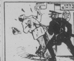
За часів “демократичної” Польщі — закон на багнеті.