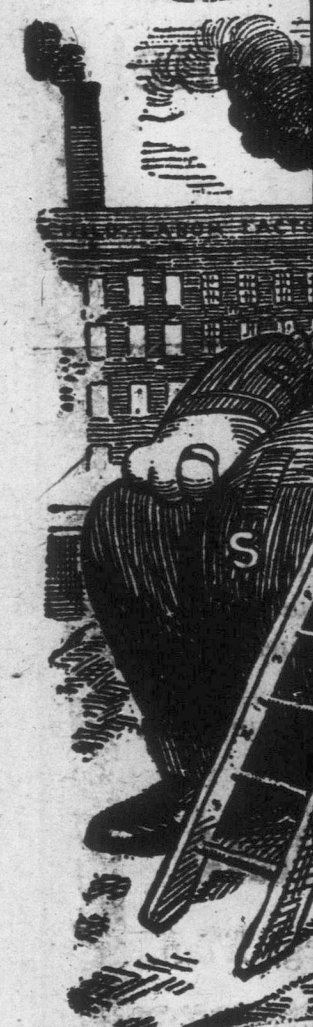
Мала дитина муси...