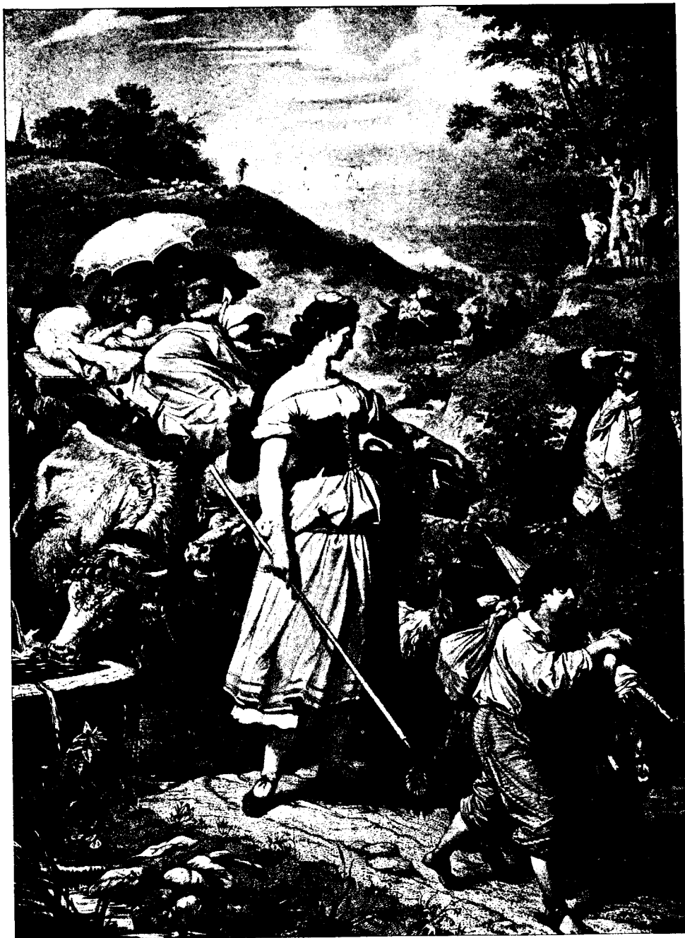
HERMANN ET DOROTHÉE, d'après m. Kaulback.