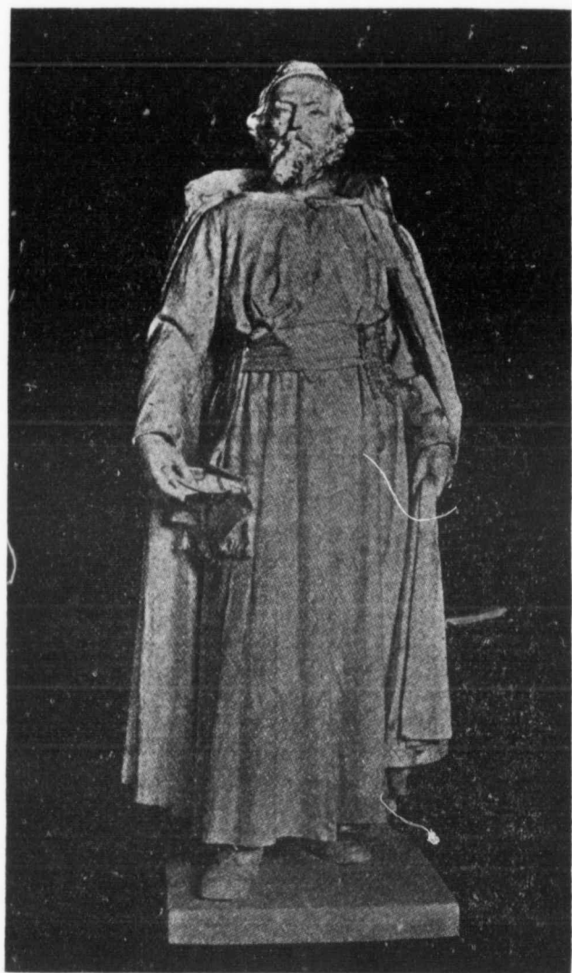
LE PERE JACQUES MARQUETTE