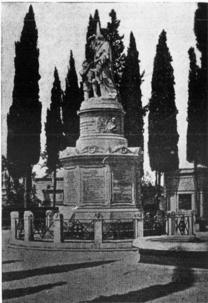
LE MONUMENT DES ZOUAVES (Cimetière de Rome)