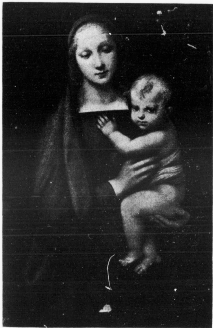
LA VIERGE MARIE (dite du Grand Duc.)