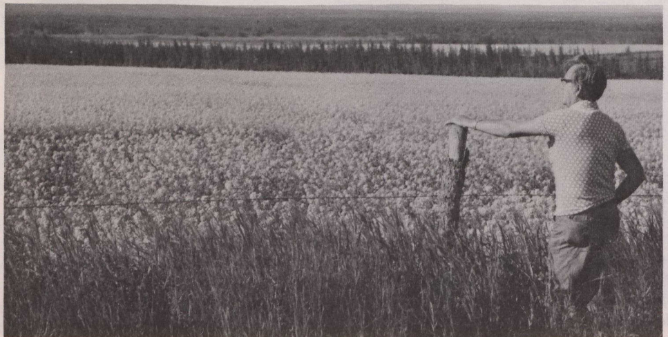
Champ de colza dans la vallée de Peace River (Colombie-Britannique).

Prévisions pour 1981 des revenus bruts et nets réalisés: Île-du-Prince-Édouard, $163 millions ($39 millions); Nouvelle-Écosse, $225 millions ($46 millions); Nouveau-Brunswick, $179 millions ($45 millions); Québec, $2,6 milliards ($591 millions); Ontario, $5,1 milliards ($640 millions); Manitoba, $1,7 milliard ($257 millions); Saskatchewan, $4 milliards ($1,3 milliard); Alberta, $3,8 milliards ($882 millions); Colombie-Britannique, $864 millions ($126 millions).