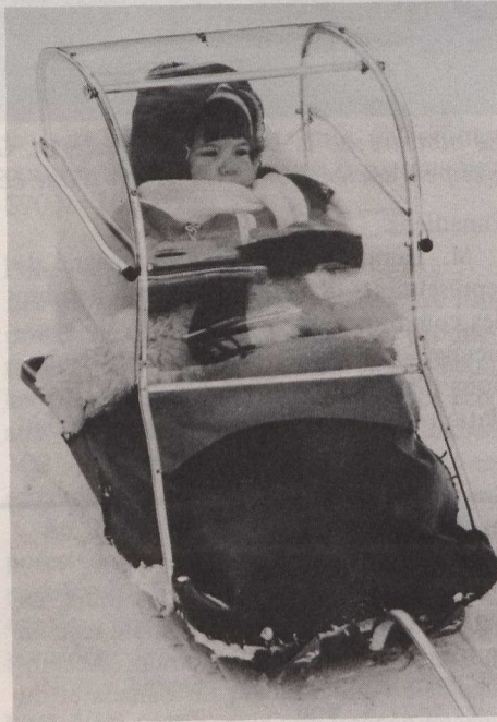
Promenade en tout confort pour bébé.

Un toit rigide de plastique protège du froid l'enfant déjà emmitoufflé dans une peau de mouton. De plus, il amortit la chute si le traîneau se renverse. L'innovation tient principalement dans le tube