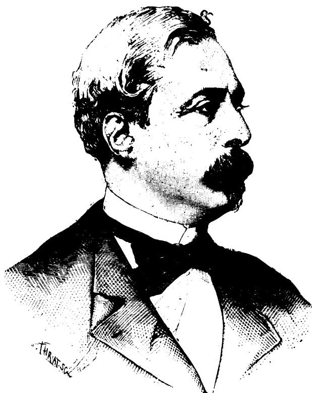
SIR RICHARD WALLACE, DÉCÉDÉ

La ligne, par insertion - - - - - 10 cents Insertions subséquentes - - - - - 5 cents Tarif spécial pour annonces à long terme