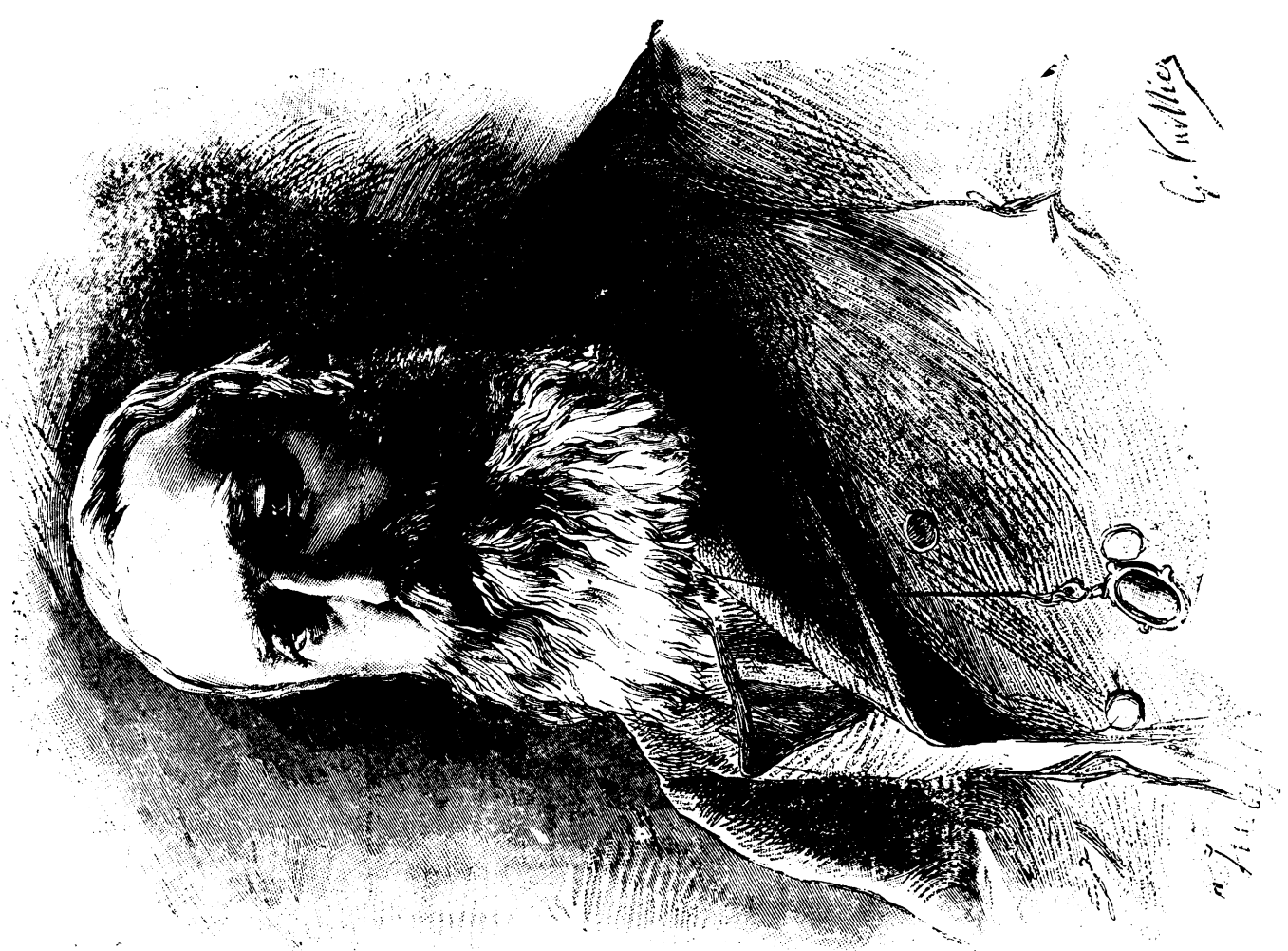
LE ROI LÉOPOLD II