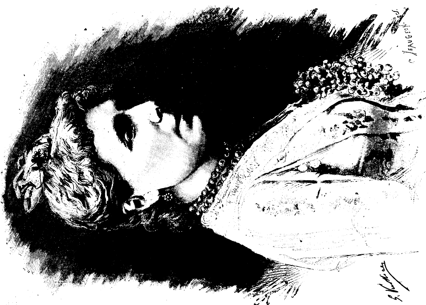
LA REINE MARIE-HENRIETTE