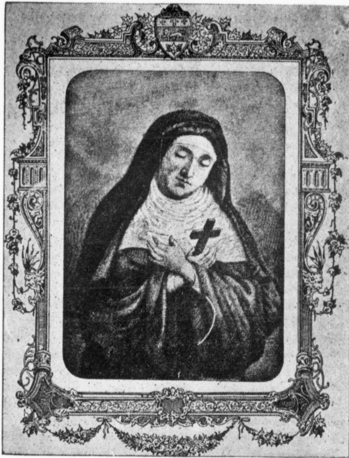
LA VÉNÉRABLE MARIE DE L'INCARNATION.