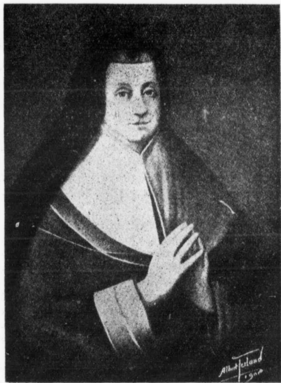
MADAME DE LA PELTRIE, Fondatrice des Ursulines de Québec, 1639.