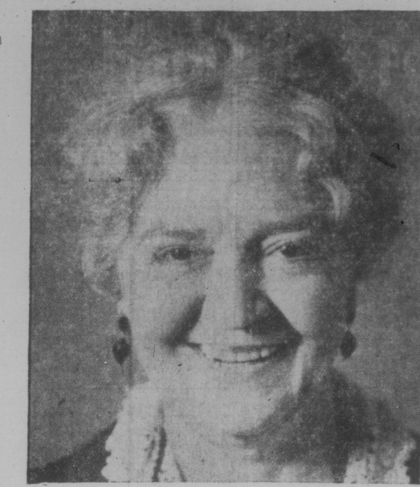
„Denken Sie nicht auch, daß eine alte Dame wie ich froh sein würde, wenn ich die Taubheit und Katarrh los sein könnte.“