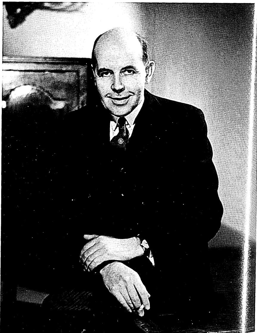
Norman A. Robertson, sous-secrétaire d'État aux Affaires extérieures, 1941-1946