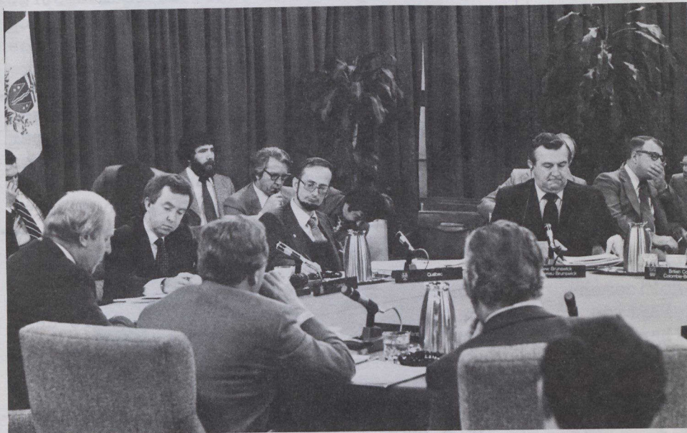
El Primer Ministro Clark (segundo a la izquierda) consulta con los representantes provinciales.

ayudar a los individuos a renovar sus calderas de petróleo. Estamos preparados a contribuir a un programa de conservación energética industrial en el Canadá atlántico. Respecto al aislamiento de viviendas, varias provincias han indicado que se servirían mejor las necesidades locales si el programa canadiense de aislamiento de viviendas quedase bajo control provincial. Estamos preparados a llegar a un acuerdo mediante el que este plan pudiera transferirse, conjuntamente con mayores fondos federales.