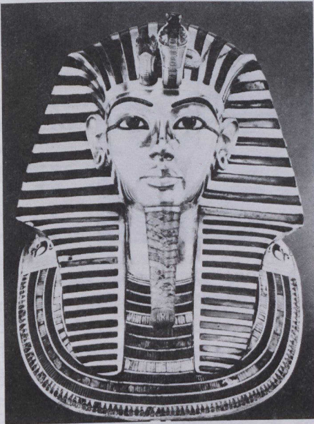
La máscara de oro de Tutankhamen fue colocada sobre la cabeza y hombros de la momia.

Canadá recibe al rey niño que solamente reinó por nueve años, pero cuya memoria perdura todavía.