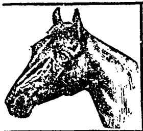
Marque de Fabrique