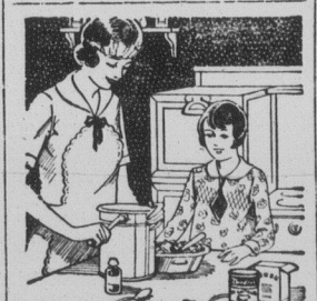
Pour Réussir Crème Glacée et Desserts Congelés

La Constitution de 1905, celle qui fut votée par le parlement fédéral au moment de la création des provinces de l'Alberta et de la Saskatchewan, garantit aux minorités religieuses le bénéfice du système scolaire existant au moment de l'entrée des nouvelles provinces dans la Confédération. Or ce système d'écoles était profondément défectueux, à cause de différents amendements votés par la législature des Territoires du Nord-Ouest, amendements qui d'ailleurs étaient probablement "ultra vires", parce qu'ils détruisaient les effets d'une loi fédérale