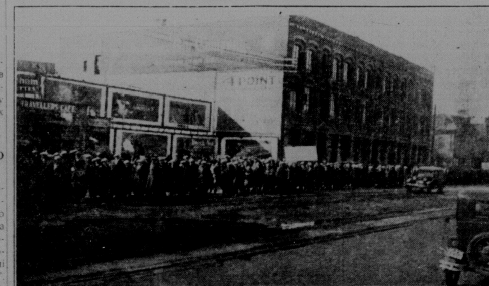
Похід безробітних на Мейн стріті доходить до Бродвею.

БЕРЛІН, 12 березня. — Сім фашистів є під арештом у зв'язку з убивством комуніста Кужова та поранення трохи інших товаришів у Рентгеніау.