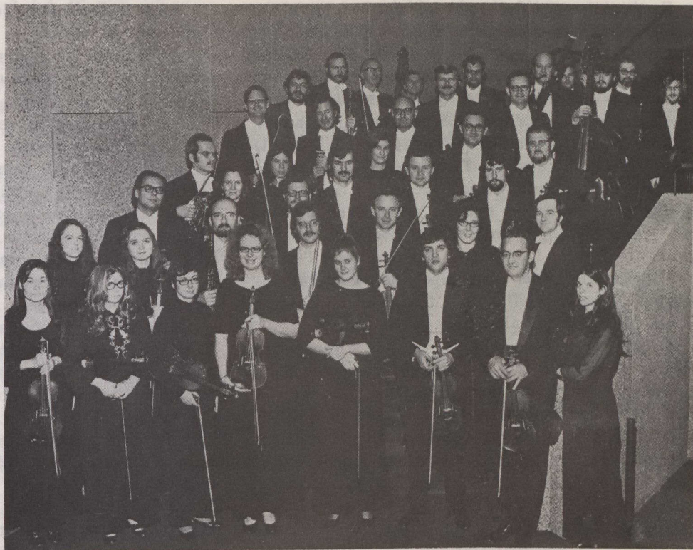
Les membres de l'Orchestre du Centre national des Arts.