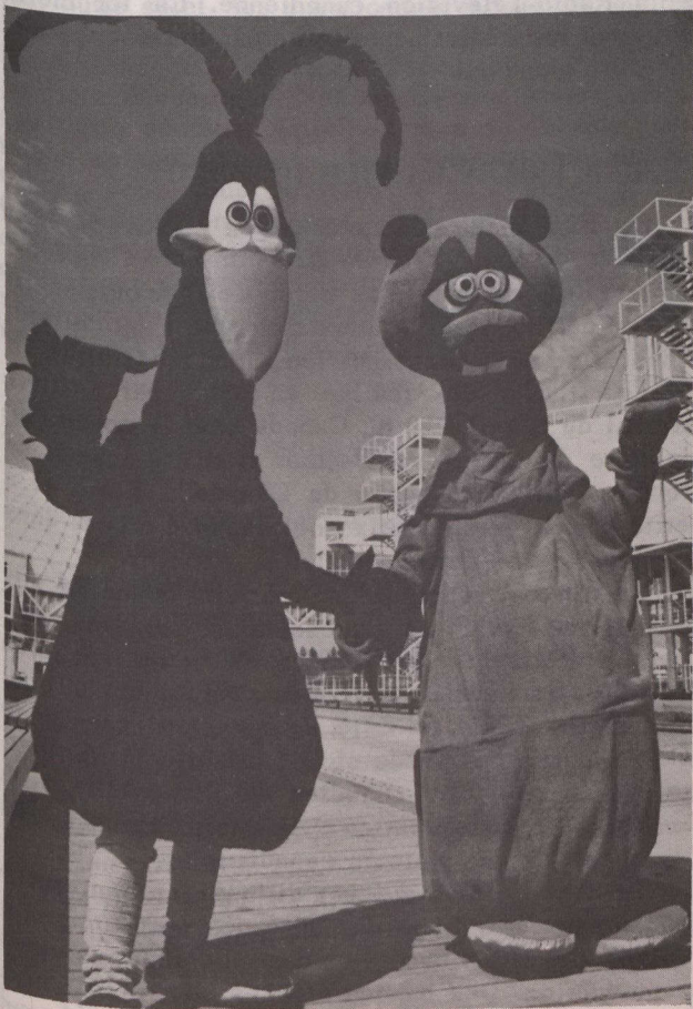
La corneille placide et le castor timide

Pour rafraîchir les visiteurs, Mme Petrova a installé, à l'intérieur des personnages, un système de climatisation intégré comportant quatre ventilateurs actionnés par des piles, encastrés dans des