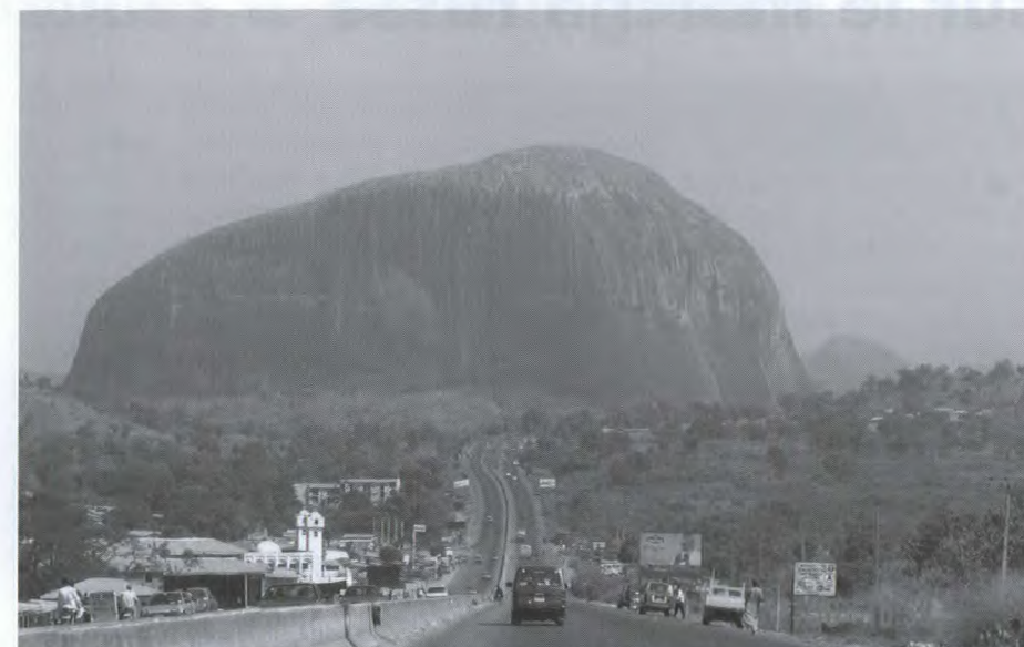
Le rocher Zuma surplombe Abuja, capitale du Nigéria depuis 1991.

Sur le plan politique, depuis le rétablissement de la démocratie au Nigéria en 1999, le Canada et le Nigéria entretiennent des liens solides et étroits. Les entreprises nigérianes sont toutes disposées