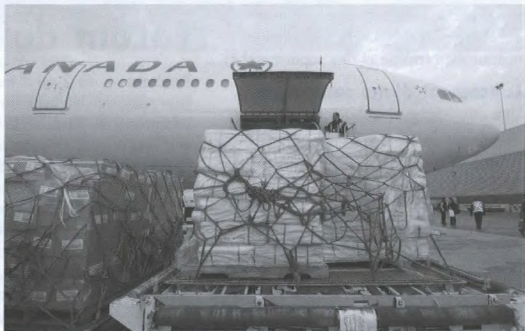
Les entreprises canadiennes font le nécessaire : un A340 d'Air Canada, qui s'apprête à décoller en direction de Jakarta, reçoit une pleine cargaison de provisions dont on a grand besoin.

De leur côté, les entreprises canadiennes ont été nombreuses à venir en aide aux victimes du tsunami. Le numéro un mondial de la production d'engrais, Potash Corp of Saskatchewan Inc., a annoncé un don de 1,2 million de dollars. La compagnie de Brampton en Ontario, Nortel Networks, et ses employés ont offert plus d'un million de dollars d'aide. La compagnie minière Inco et sa filiale indonésienne PT International Nickel Indonesia ont offert 540 000 $, et le second fournisseur de services de téléphonie canadien, Telus, 500 000 $. Canadian Tire, Home Hardware, la Compagnie de la Baie d'Hudson et Bureau en Gros ont chacune promis de verser 250 000 $.