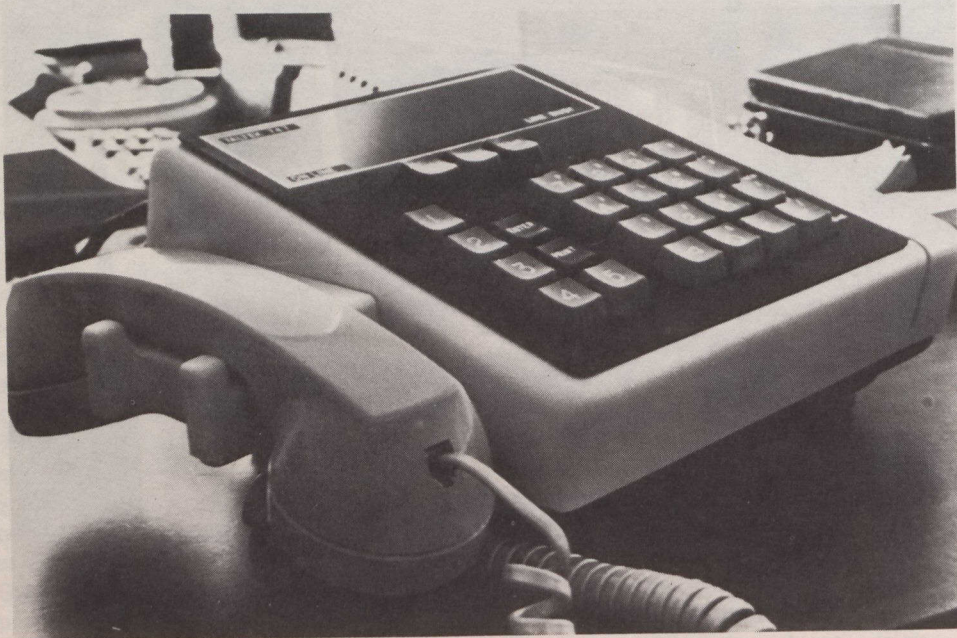
Le terminal 747VF de Taltex Electronics Ltée est fiable, polyvalent, rapide et peu coûteux. Il permet de vérifier instantanément des transactions.