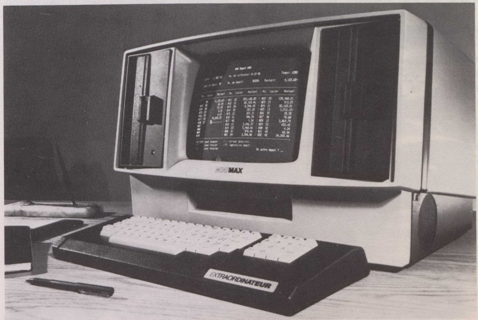
Minimax, le nouvel ordinateur de bureau fabriqué par Extraordinaireur Inc. et compatible avec un grand nombre de logiciels, effectue le traitement des textes bilingues.

L'industrie informatique est une branche de plus en plus importante de l'activité économique au Canada. Alors que le Canada se lance dans la révolution informatique et que l'utilisation des ordinateurs se répand rapidement, ses produits et services influencent de nombreux autres secteurs de l'économie. Avec les progrès techniques, des marchés énormes vont surgir tant du côté des entreprises que des consommateurs et l'évolution continuera sans doute à un rythme rapide.