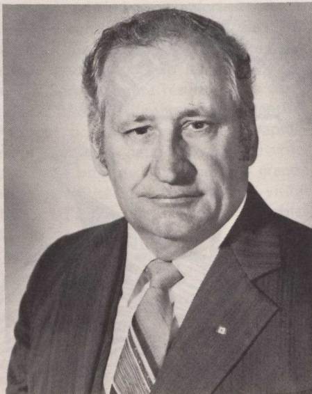
M. Eugene Whelan

à laquelle il n'était pas membre du gouvernement. M. Whelan entend mettre son autorité de président du Conseil au service de l'amélioration de la sécurité alimentaire dans les pays en développement. Il s'intéressera particulièrement à l'élimination des contraintes qui entravent la production alimentaire dans les pays à faible revenu et dont la balance alimentaire est déficitaire, surtout en Afrique, où les problèmes sont les plus graves.