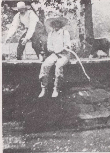
Une scène de Lone Fisherman , 1897 (Edison).