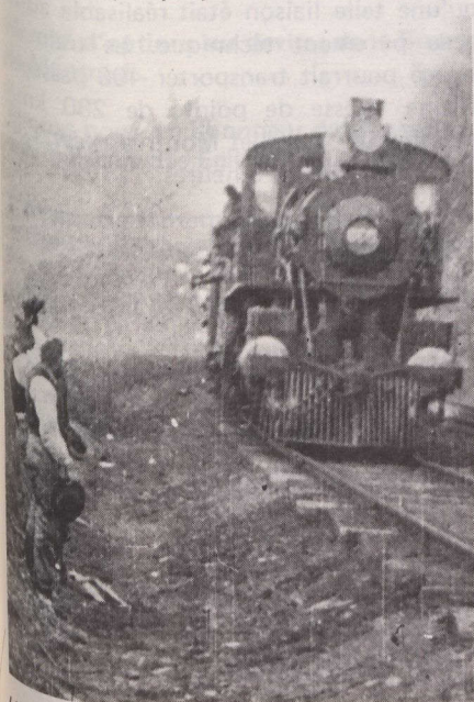
Une scène de Black Diamond Express , 1897 (Edison).