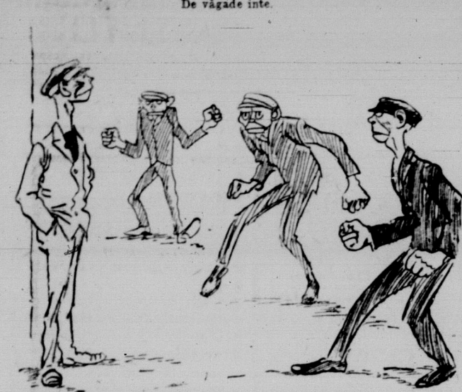
De vågade inte. Det syns tydligt, att de där tre grabbarna äro rasande arga på nr 4...