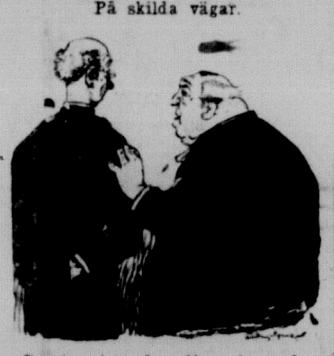
På skilda vägar. Jag vill veta det — därför frågar jag. Nival — må hin ta er — jag är rik...