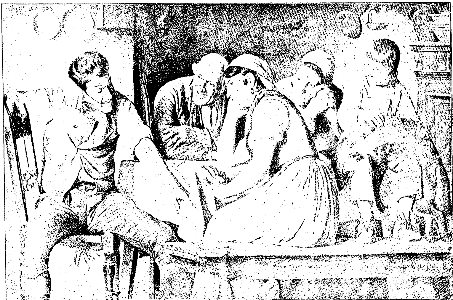
Le chasseur, absorbé dans son sujet.—Je l'avais manqué deux fois à la même place.