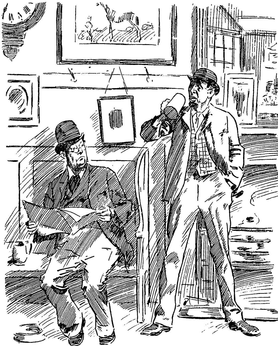
Pacifique. — En lisant ces choses-là, c'est à se demander quel est l'avantage d'être honnête. Roublard. — Je ne saurais te le dire; je ne l'ai jamais essayé.

breux avantages, la considération de vos fournisseurs, sans compter la joie sans pareille de contribuer, pour sa petite part, à renverser, de ci de là, un ministère.