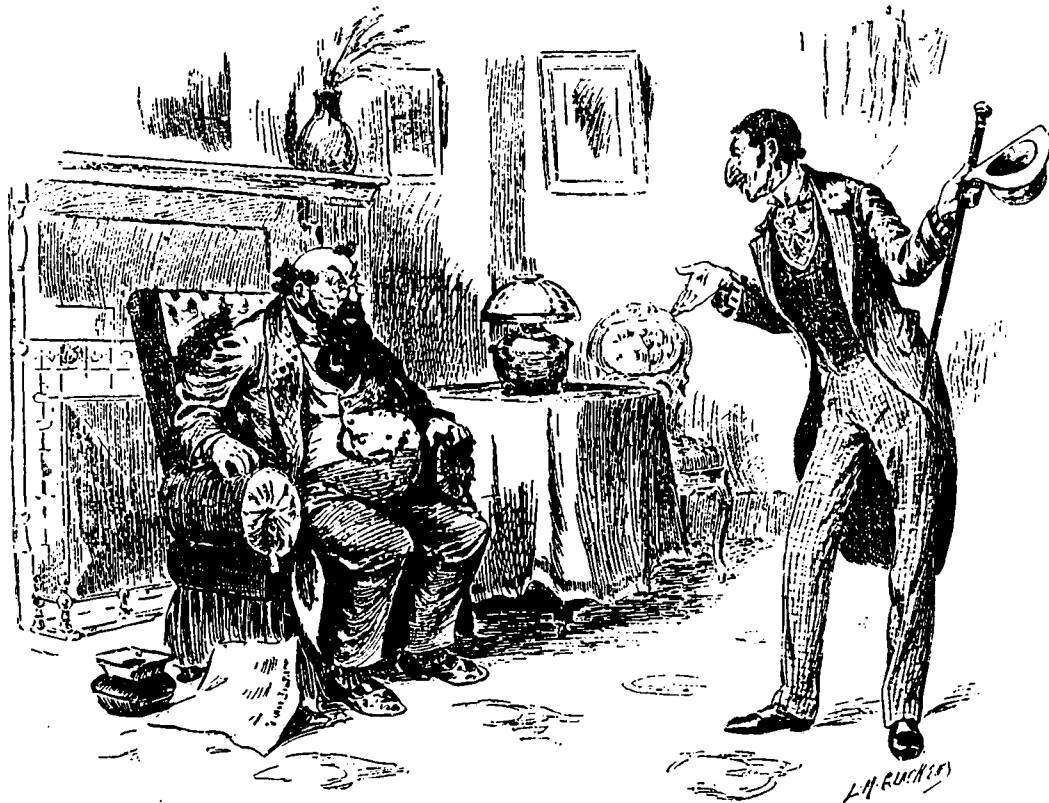
Monsieur Sacapiastres —Ma fille ! J'aimerais mieux qu'elle fût morte, que de la voir votre femme. L'aventurier. —Pardou ! Je ne savais pas que sa vie est assurée.