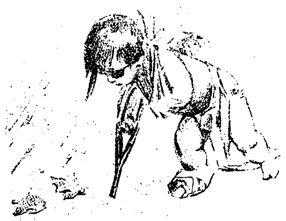
La fin des vacances.