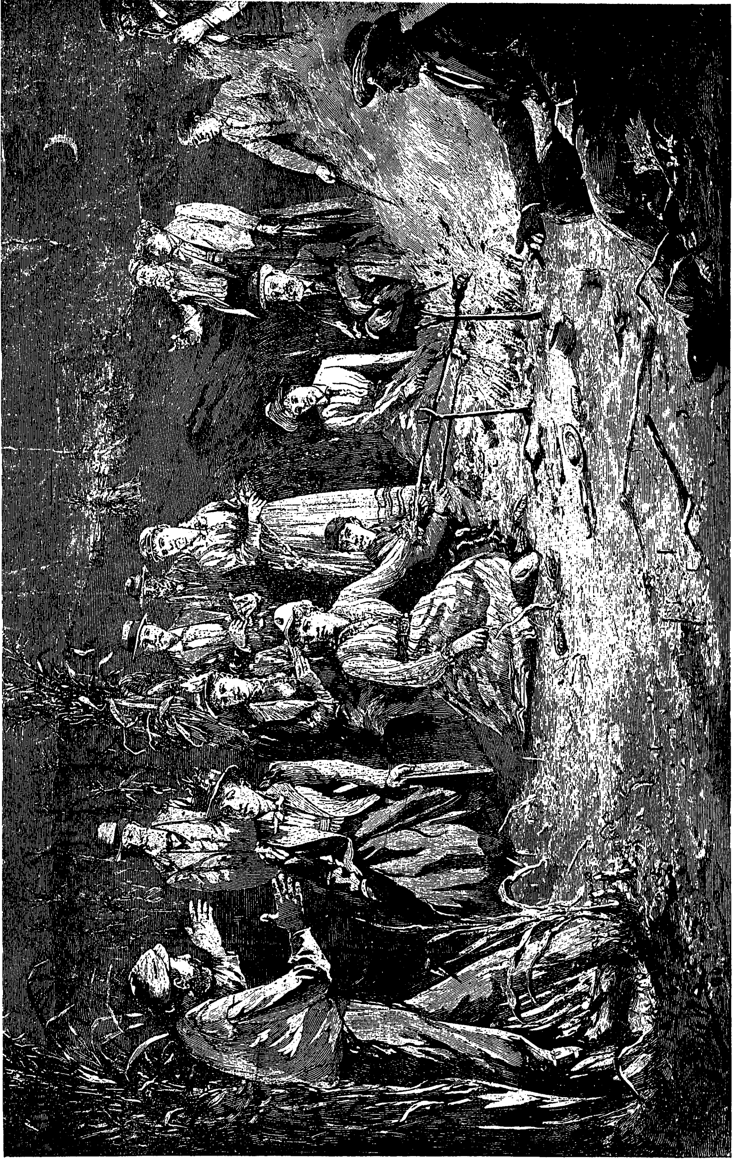
UNE ÉPLUCHETTE DE BLÉ D'INDE.