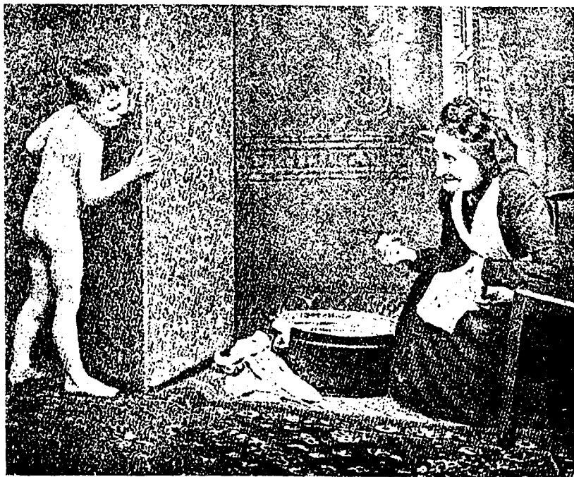
627 D'un des jumeaux.—Chique, grand'maman ! Tu m'as baigné deux fois de suite. Mon petit frère n'est pas ici ce soir.