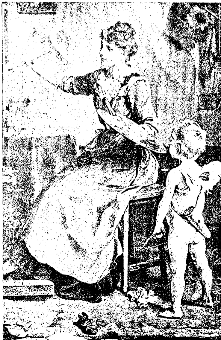
Jeune artiste faisant un valentin sous les yeux de son professeur.