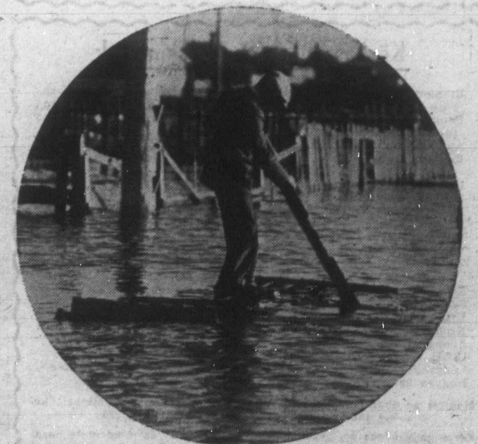
Az Óhazában — különösen a megszállók birtokában levő elhanyagolt területeken — borzalmas pusztításokat vitt véghez az árvíz. Egész falvak mentek tönkre az Erdélyi határos vidékeken és rengeteg magyar család vált hajléktalanná.

MUTASSA MEG ÁLLANDÓAN ANGLÓ/CIKKEINKET ISMERŐSEINK