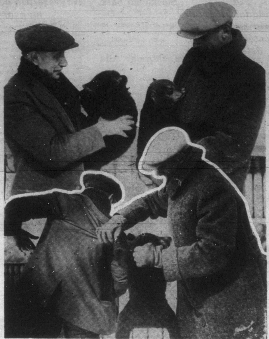
Ilyenkor tavasszal még a kis medvebocokban is táncol az élet, legalábbis erre vall a bemutatott jelenet. Ugy látszik a mackók még kölyök-korukban is többre becsülik a függetlenséget a gondos ellátásnál.

A tárgyaláson az is kiderült, hogy a kanadai dukoborok 18 ezer dollárt küldtek neki Oroszországba 1927-ben utazási költséggül, hogy a british-columbiai Farron mellett felrobbant személynővonal utasai között odavezesse édesapja helyét, mint a kanadai dukoborok fővezére elfoglalja.