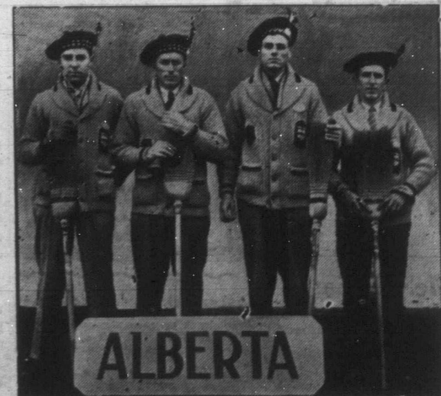
A legnyugatibb prérítartomány négy büszke skótja látható fenti képünkön, akik első díjat nyertek a legutolsó "bowling", azaz súlygörgő versenyen. A skótok a népies tányérsapka mellett még a tekepályát tisztogató seprűt is nagy becsben tartják s csupán a szoknya hiányzik a fenti viseletből.

Erre a nagy kérdésre kell majd válaszolni annak a hat izlandi származású manitobai halásznak, akik The Pasból hamosan megindulnak Churchill felé, hogy az ottawai kormány megbízásából felbecsüljék a kanadai közlekedési hálózatba legújabban bekapcsolt tengerből halállományát. Az eddigi jelentések ugyan arról tesznek tanúságot, hogy egyes vidékeken akad hal bőven, ezuttal inkább azt kell majd megállapítani a halászati szakembereknek, hogy található-e olyan mennyiségben hal a Hudson-öbölben hogy a kereskedelmi halászatot jövedelmezővé tegye.