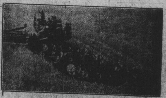
LA RECOLTE DANS L'OUEST