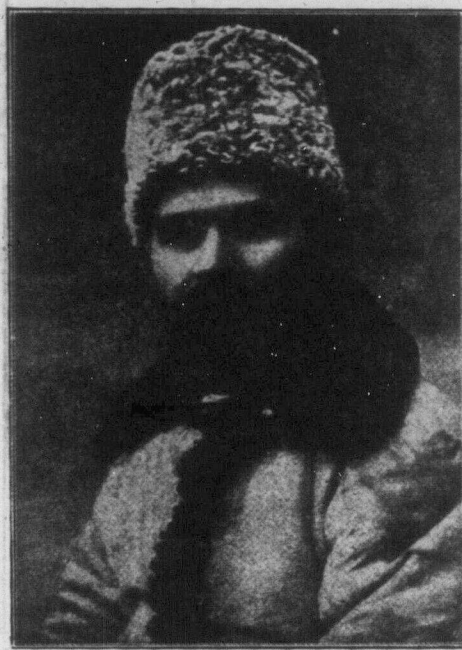
Г. І. ПЕТРОВСЬКИЙ, председатель Всеукраїнського Центрального Выполнительного Комитета.