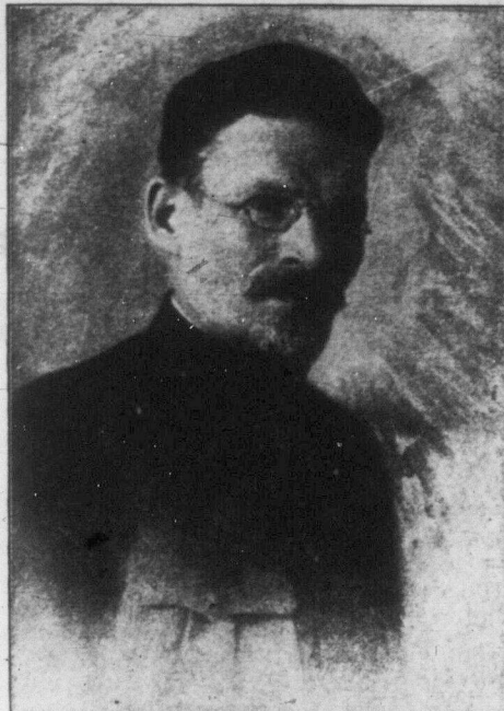
МИХАЙЛО І. КАЛІНІН, председатель Всероссийского Центрального Выполнительного Комитета.

Завзята боротьба проти сівітської влади послідовно за-