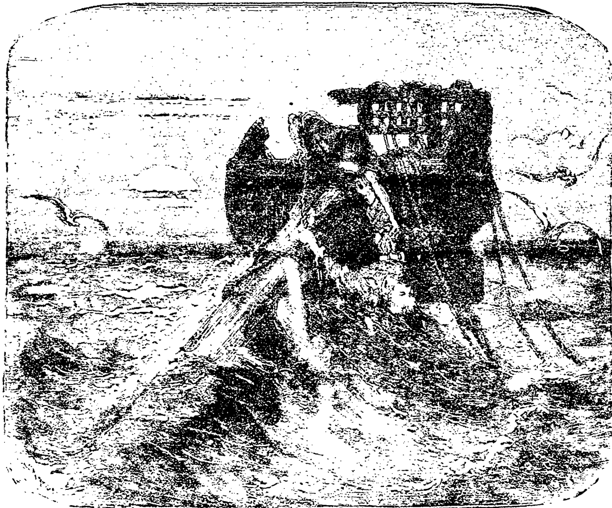
Un jeune gars se tenait cramponné..... (Page 201)

Septième partie de VŒU DE HAINE Par ERNEST CAPENDU