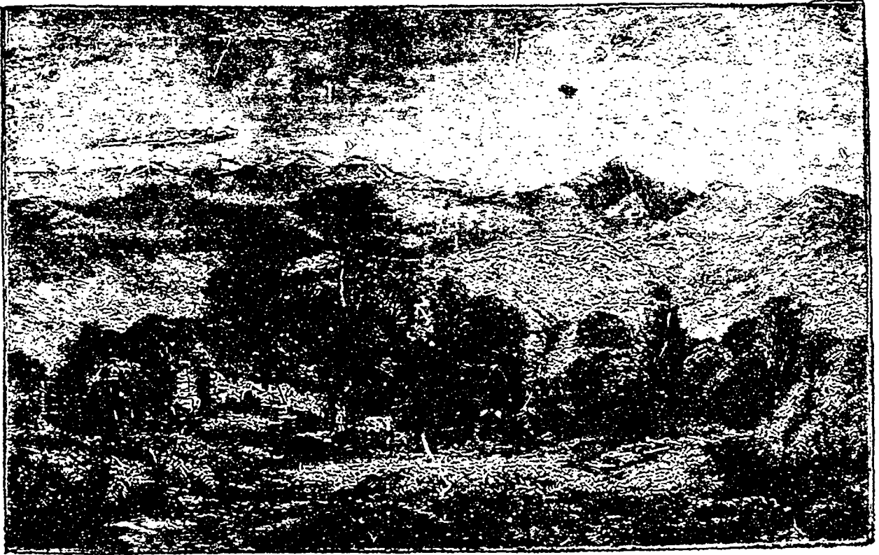
A l'est, c'est la terre avec ses montagnes.... (Page 210)

— Monsieur le marquis, permettez-moi de vous dire que ce