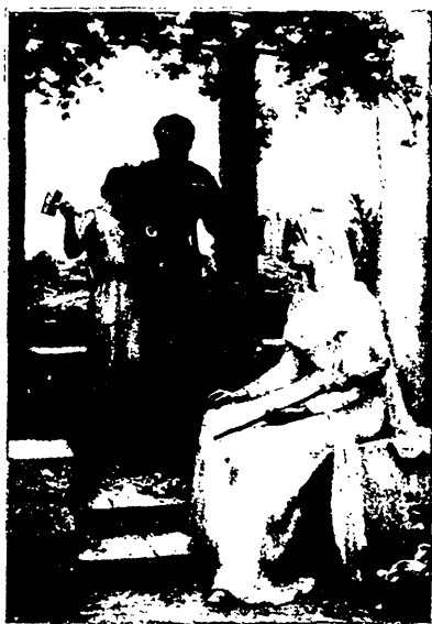
LA SAINTE FAMILLE DE NAZARETH

Au Sacré-Coeur de Jésus A la Vierge Immaculée A saint Joseph, patron des artisans Ce modeste travail est dédié