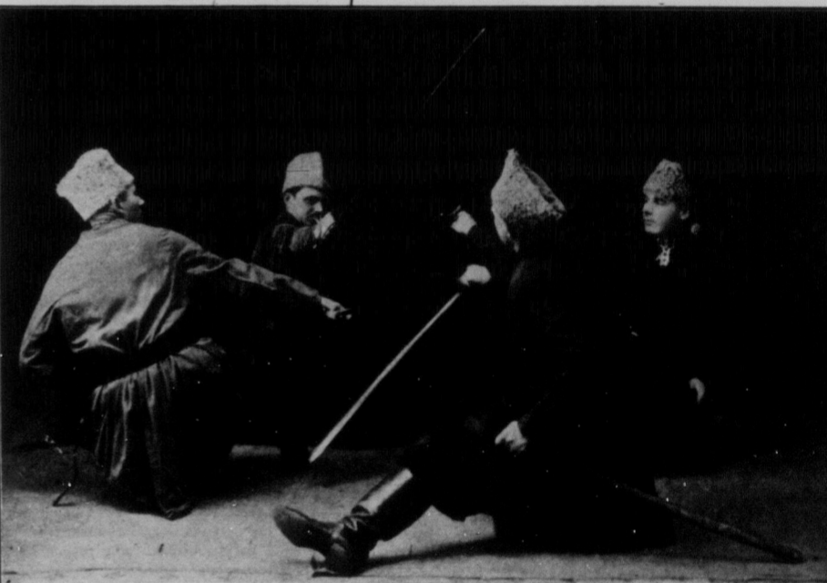
БОЄВИЙ ТАНОК "ЗАПОРІЖСЬКИЙ КОЗАК".

Виконують учні школи українських народних танків при відділі ТУРФДім у Вінніпегу, які в по-двійному числі виступлять в суботу, 5. березня на сцені Укр. Роб. Дому.